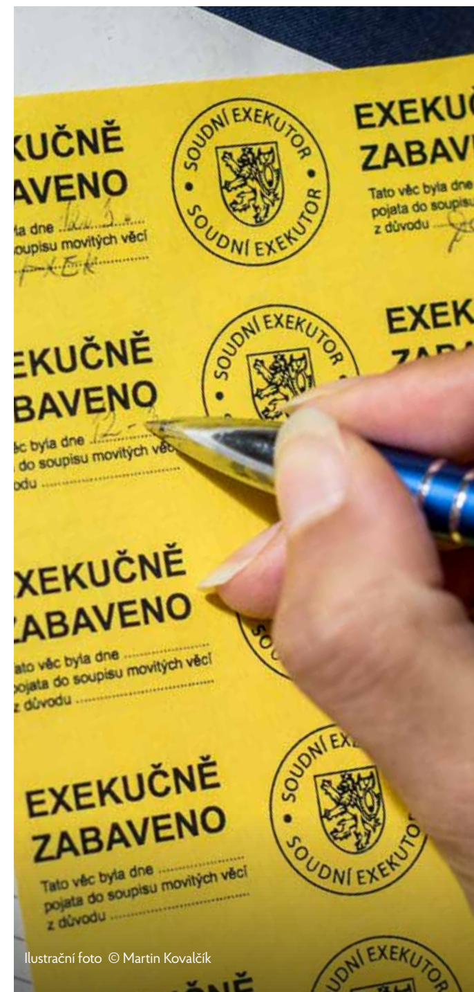
Ilustrační foto © Martin Kovalčík

Pokud rozhodce určený podle rozhodčí smlouvy podepsané po 1. 4. 2012 nezkontroluje, jestli je úvěrová smlouva v souladu se zákonem, a pokud dokonce přiznává úvěrové společnosti neúměrné plnění (vysoké odměny, likvidační sankce), jedná tak v rozporu s dobrými mravy a jeho rozhodnutí je proto neplatné. Neplatný je pak i rozhodčí nález, který rozhodce vydal. A exekuce, která je na základě takového rozhodčího nálezu vedená, je nezákonná! V takovém případě je na místě se bránit a žádat zastavení exekuce (viz níže)!